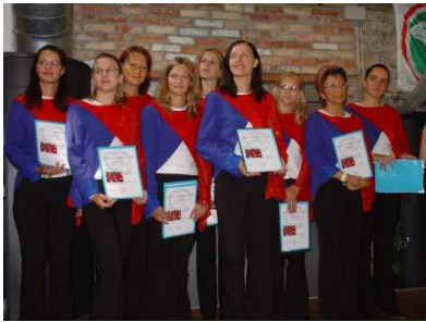
Bodensee Cup, 2005