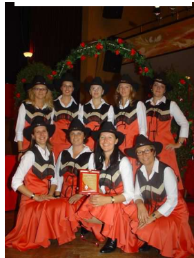
1. ACWDC, 2007